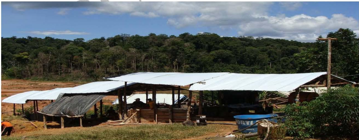
Figura 4 – Visão panorâmica da planta piloto